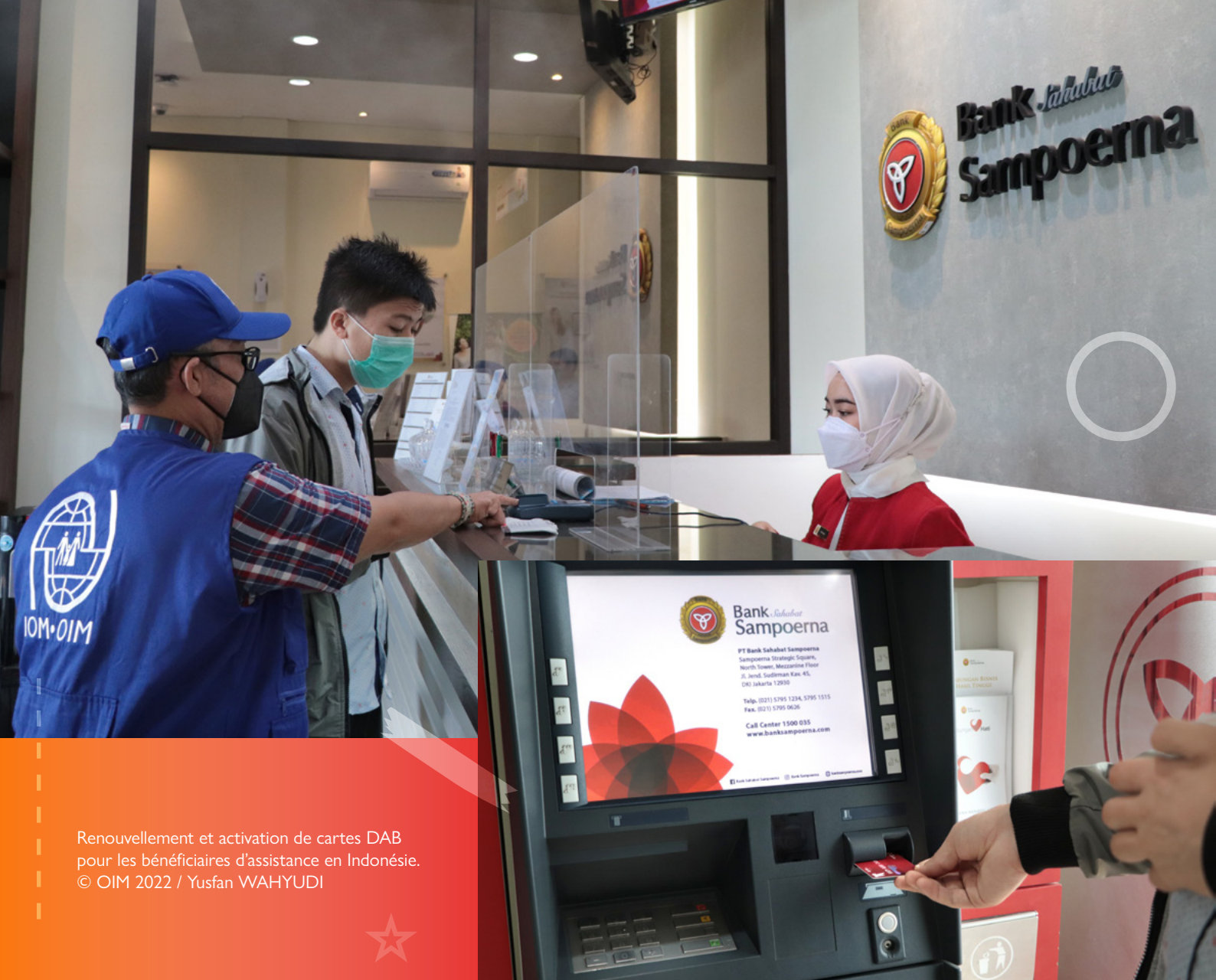
Renouvellement et activation de cartes DAB pour les bénéficiaires d'assistance en Indonésie.