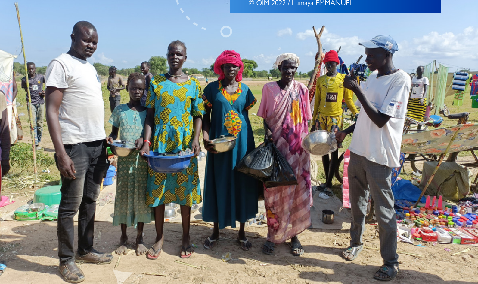
Des bénéficiaires de l'assistance achètent des produits non alimentaires et d'autres produits sur un marché libre après avoir reçu de l'assistance en espèces à Twic au Soudan du Sud.