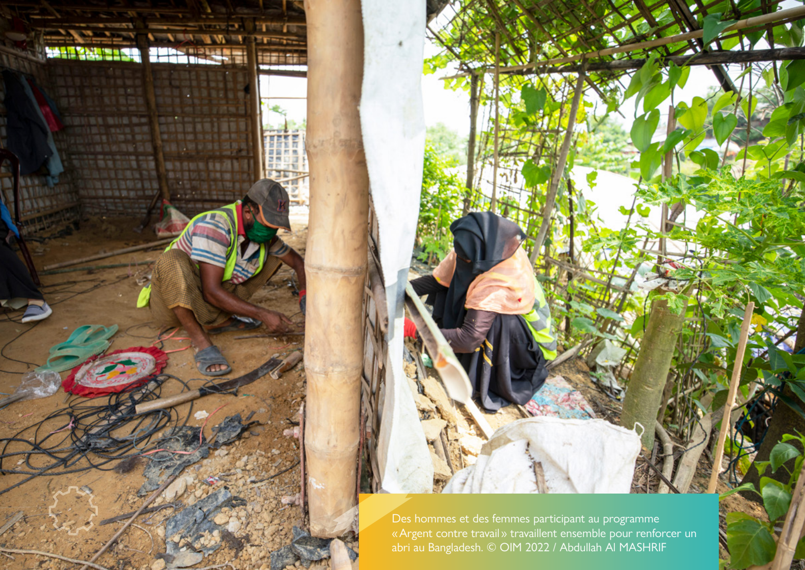
Des hommes et des femmes participant au programme « Argent contre travail » travaillent ensemble pour renforcer un abri au Bangladesh.

4. Les bénéficiaires des TM sont mieux habilités à gérer leurs biens grâce à l'inclusion financière et numérique. Les TM favorisent l'inclusion financière et sont liés à des solutions durables. Les TM et les approches basées sur le marché favorisent l'inclusion financière et numérique, lorsque la réglementation nationale y est favorable. L'OIM encouragera l'inclusion financière et numérique en cherchant à distribuer des espèces par des comptes appartenant aux bénéficiaires, tels que des comptes bancaires ou des comptes de téléphone mobile, dans la mesure du possible. Le fait de tirer parti de la localisation ouvrira la voie à des systèmes en boucle ouverte qui s'appuient sur les marchés et les écosystèmes locaux. L'inclusion financière peut à son tour aider les populations touchées à faire la transition vers l'autonomie et l'inclusion économique.