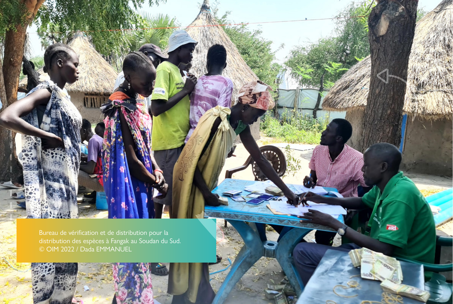
Bureau de vérification et de distribution pour la distribution des espèces à Fangak au Soudan du Sud.