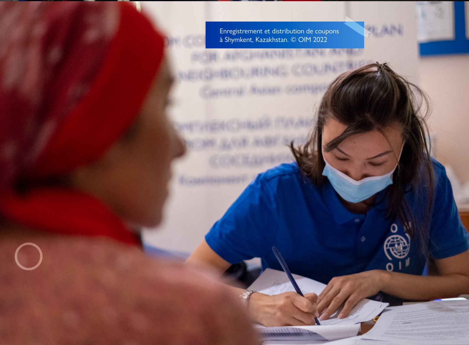
Enregistrement et distribution de coupons à Shymkent, Kazakhstan.