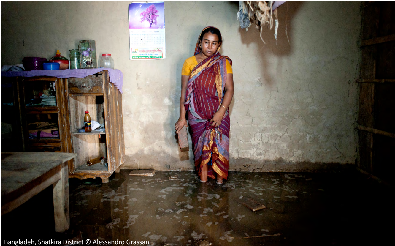
Bangladesh, Shatkira District