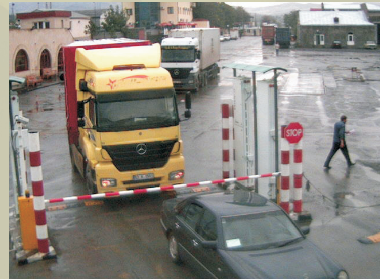
Իրական ժամանակում իրականացվող վարույթը սահմանի հսկիչ անցագրային կետում: Հեռակա դիտորդը կարող է հեղուկ սահմանի հայրման հսկիչ կետում տեղադրված տեսախցիկի նկարահանմանը և անհրաժեշտության դեպքում պարկերի վրա մատնանշել հեղաբեռության առարկան:

Համակարգում կիրառված են ժամանակակից տեխնոլոգիաներ: Համակարգն աշխատում է փաստաթղթեր կարդացող/լուսանկարող սարքերի, տվյալները հեռահար կարդացող, կենսաչափական տվյալներ գրանցող և կարդացող սարքերի հետ: Համակարգն ինտեգրում է երկրատեղեկատվական տեխնոլոգիա, աշխատում է SMS, GPRS պրոտոկոլներով, համապատասխանում է Քաղաքացիական ավիացիայի միջազգային կազմակերպության հանձնարարականներին և այլ ստանդարտներին: