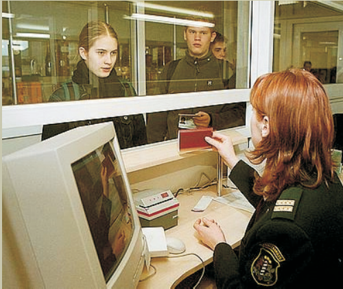
Սահմանապահը ստուգում է ուղևորի անձնագիրը

լացման հետևանքով աճել է ուղևորությունների թիվը, որը տվել է բազմաթիվ դրական արդյունքներ: Ինչևէ, այն ուղեկցվում է նաև բացասական և անցանկալի երևույթներով, ինչպիսիք են թրաֆիքինգն ու մաքսանենգությունը, ապրանքների ապօրինի փոխադրումներն ու միջազգային ահաբեկչությունը, որոնք հնարավոր է կանխարգելել՝ ելքի, տարանցիկ և ընդունող երկրներում միգրացիայի կառավարման կարողությունների հզորացման միջոցով: ՄՄԿ-ը համոզված է, որ լավ կառավարվող միգրացիան շահեկան է և՛ միգրանտների, և՛ հասարակությունների համար: