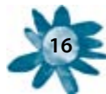
Cuadro 1. Competencias para los agentes educativos propuestos desde el programa Familia a tu lado aprendo