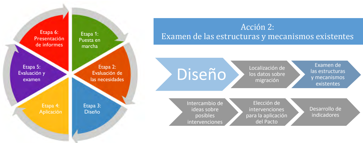
Figura 2. Proceso en seis etapas para la aplicación del Pacto Mundial para la Migración

En las orientaciones relativas a la aplicación del Pacto Mundial para la Migración Segura, Ordenada y Regular 1 , la Red de las Naciones Unidas sobre la Migración enuncia un proceso en seis etapas para la aplicación del Pacto y esboza el camino a seguir con vistas a su aplicación.