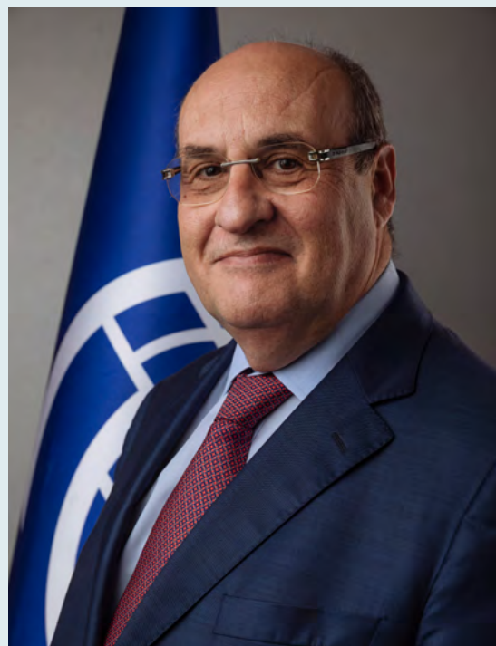
António Vitorino Director General de la OIM

Fuente: OIM, Historias ejemplares de los Indicadores de Gobernanza de la Migración (2021). Véase https://publications.iom.int/books/historias-ejemplares-sobre-los-indicadores-de-gobernanza-de-la-migracion .