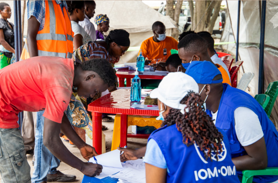
Distribución de dinero en efectivo para apoyo de alquiler para ayudar a las personas desplazadas internas en Burundi.

Todos estos factores son argumentos persuasivos para que la OIM priorice la ampliación de los PTM en todas las áreas de trabajo, incluyendo en las operaciones humanitarias, de desarrollo y de paz. Además, la OIM explorará formas de aprovechar el uso de PTM como un catalizador para soluciones sostenibles mientras los complementa con otras modalidades, cuando sea necesario y en coordinación con actores locales, para beneficiar a las personas migrantes y a las poblaciones desplazadas.