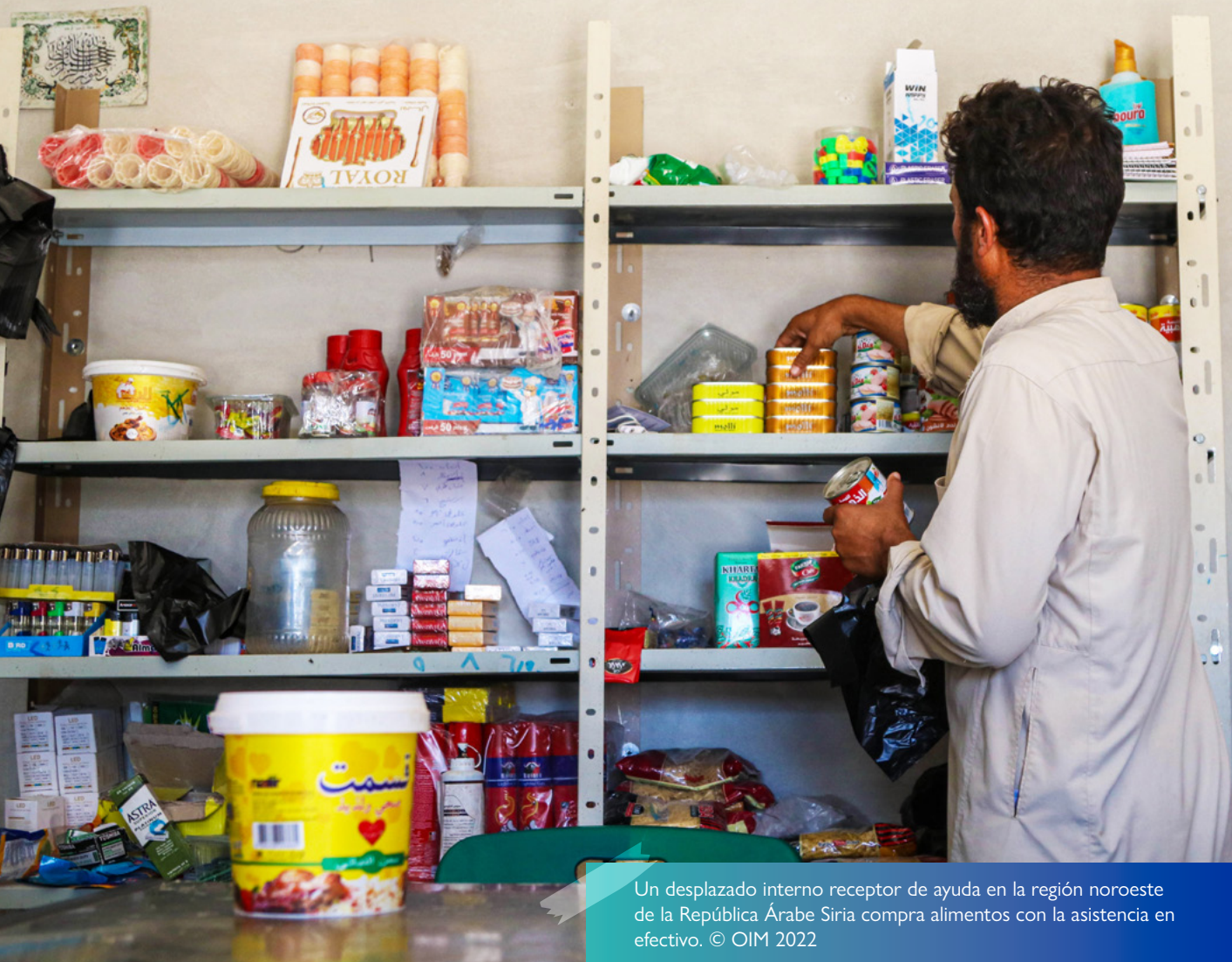
Un desplazado interno receptor de ayuda en la región noroeste de la República Árabe Siria compra alimentos con la asistencia en efectivo.

Los siguientes son los hitos que se deben alcanzar para 2026: