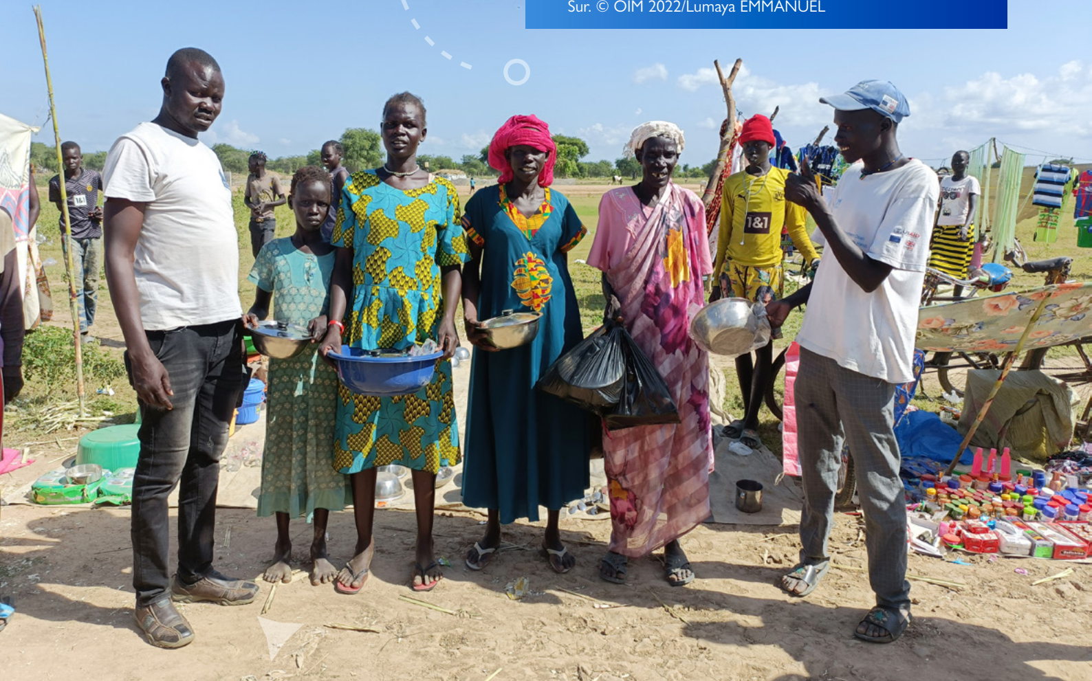
Personas beneficiarias de asistencia que compran artículos no alimentarios y otros artículos en un mercado espontáneo después de recibir asistencia monetaria en Twic, Sudán del Sur.