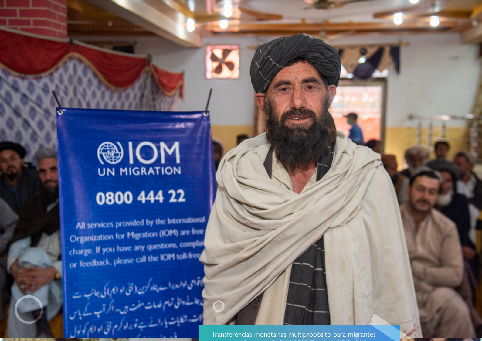
Transferencias monetarias multipropósito para migrantes afganos en Pakistán.