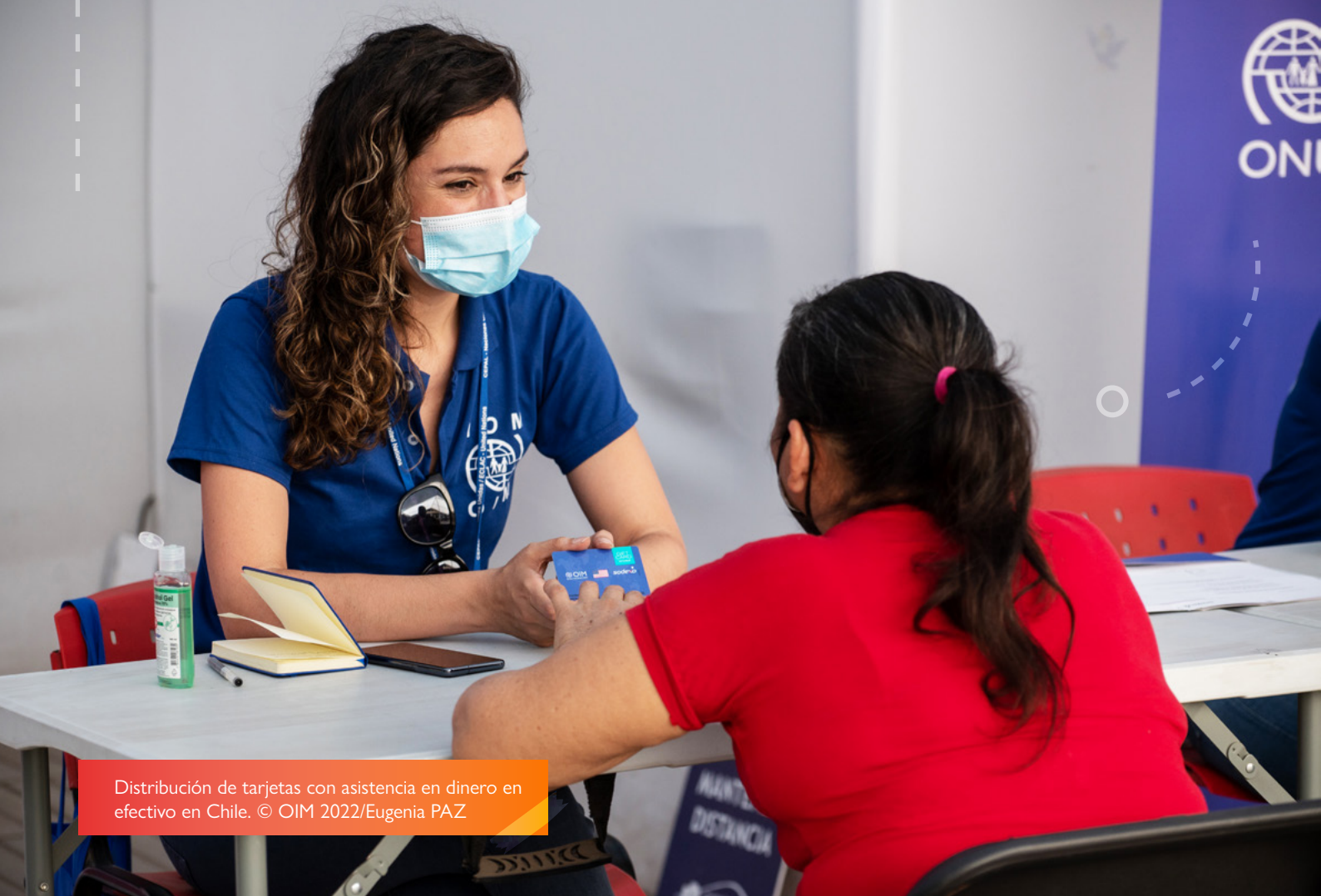
Distribución de tarjetas con asistencia en dinero en efectivo en Chile.