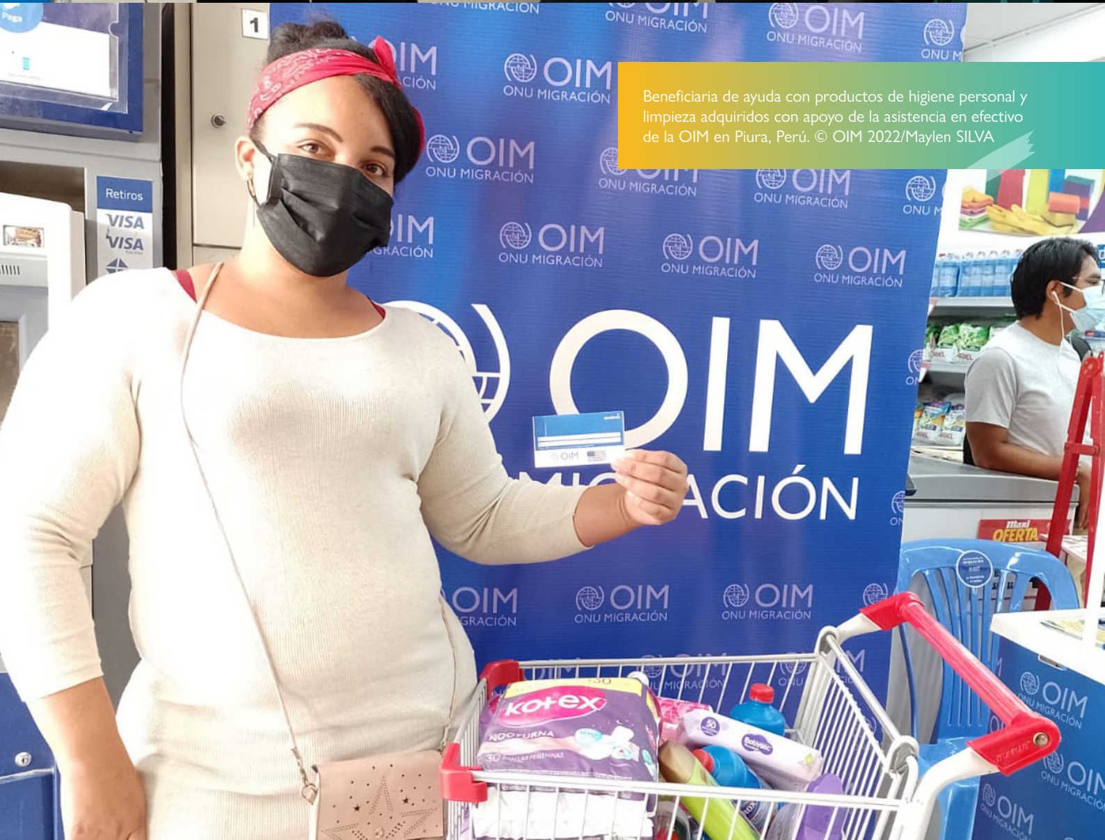
Beneficiaria de ayuda con productos de higiene personal y limpieza adquiridos con apoyo de la asistencia en efectivo de la OIM en Piura, Perú.