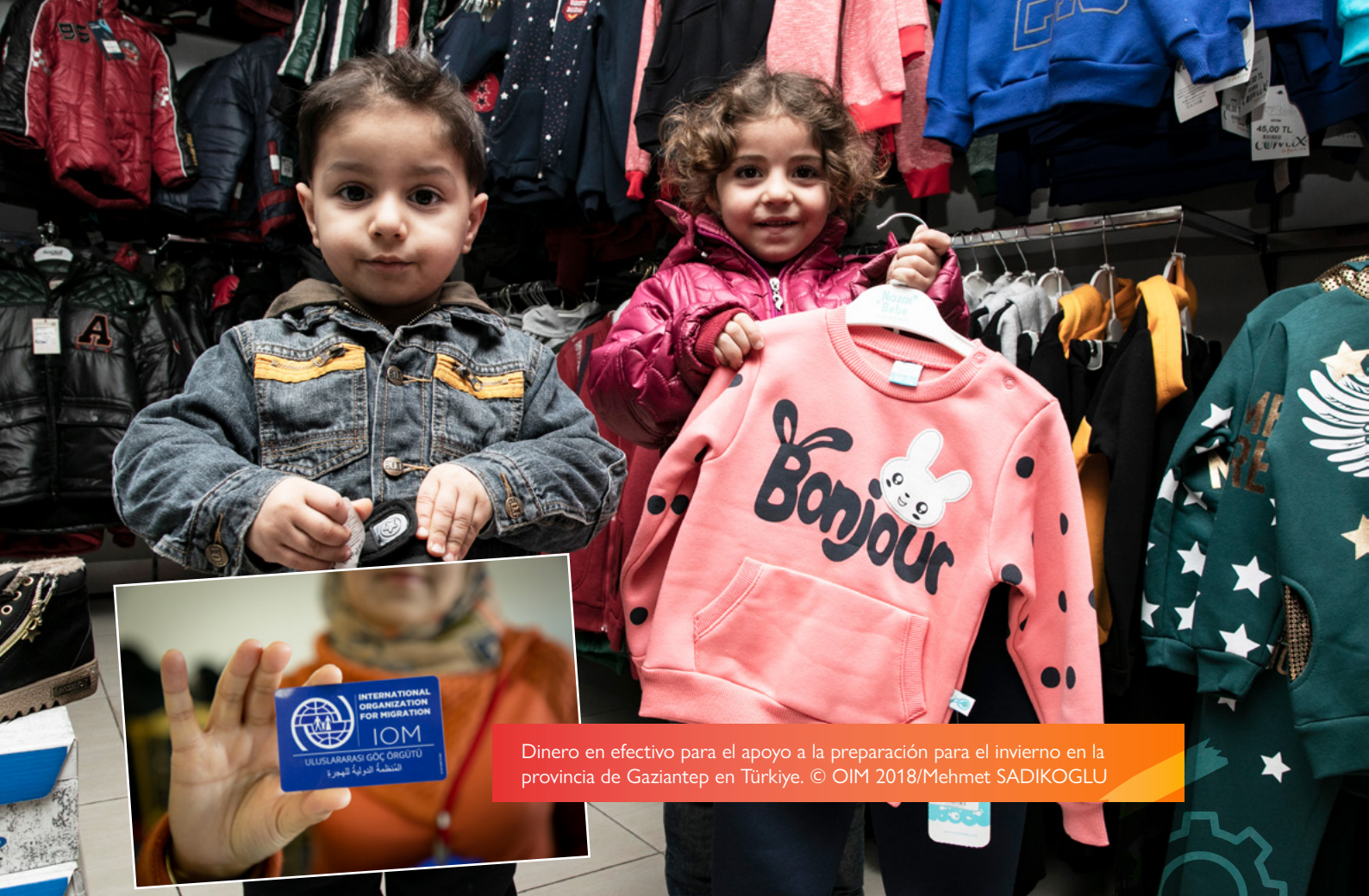
Dinero en efectivo para el apoyo a la preparación para el invierno en la provincia de Gaziantep en Türkiye.