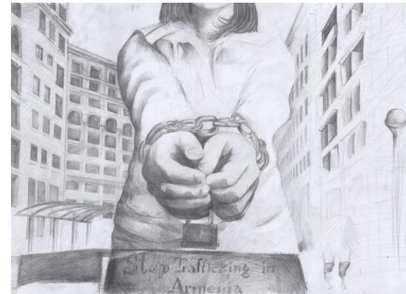
Սուրեն Հովսեփյան «Արևածաղիկ»

Նրան տեսա միայն հեռանալուց հինգ ամիս անց փողոցի անկյունում: Չբարևեց, գլուխը կախ անցավ: Հաջորդ առավոտյան եկավ, նստեց աստիճանների դիմաց ու սկսեց դժվարությամբ պատմել. «Ինձ խաբեցին ու ինձ նման մի քանի երիտասարդների նույնպես: Սոված էինք մնում օրերով, հաց տալիս էին միայն շաբաթ օրերին՝ մի կտոր, այն էլ՝ սև... Պահում էին նկուղում, ուր ոչինչ չկար, միայն մկներ էին ու թռչունների լքված բներ: Ստիպում էին, որ թալանեինք մարդկանց ու մուրացկանություն անեինք: Վախենում էինք փախչել, հսկում էին մեզ... Այդ ամենից հետո չեմ կարողանում նայել մարդկանց աչքերին, թվում է, թե ինձ կճանաչեն: Արդեն որոշել եմ՝ էլ երբեք չեմ հեռանա մեր գյուղից, այստեղ ես ապահով եմ: Ես սխալվում էի»: