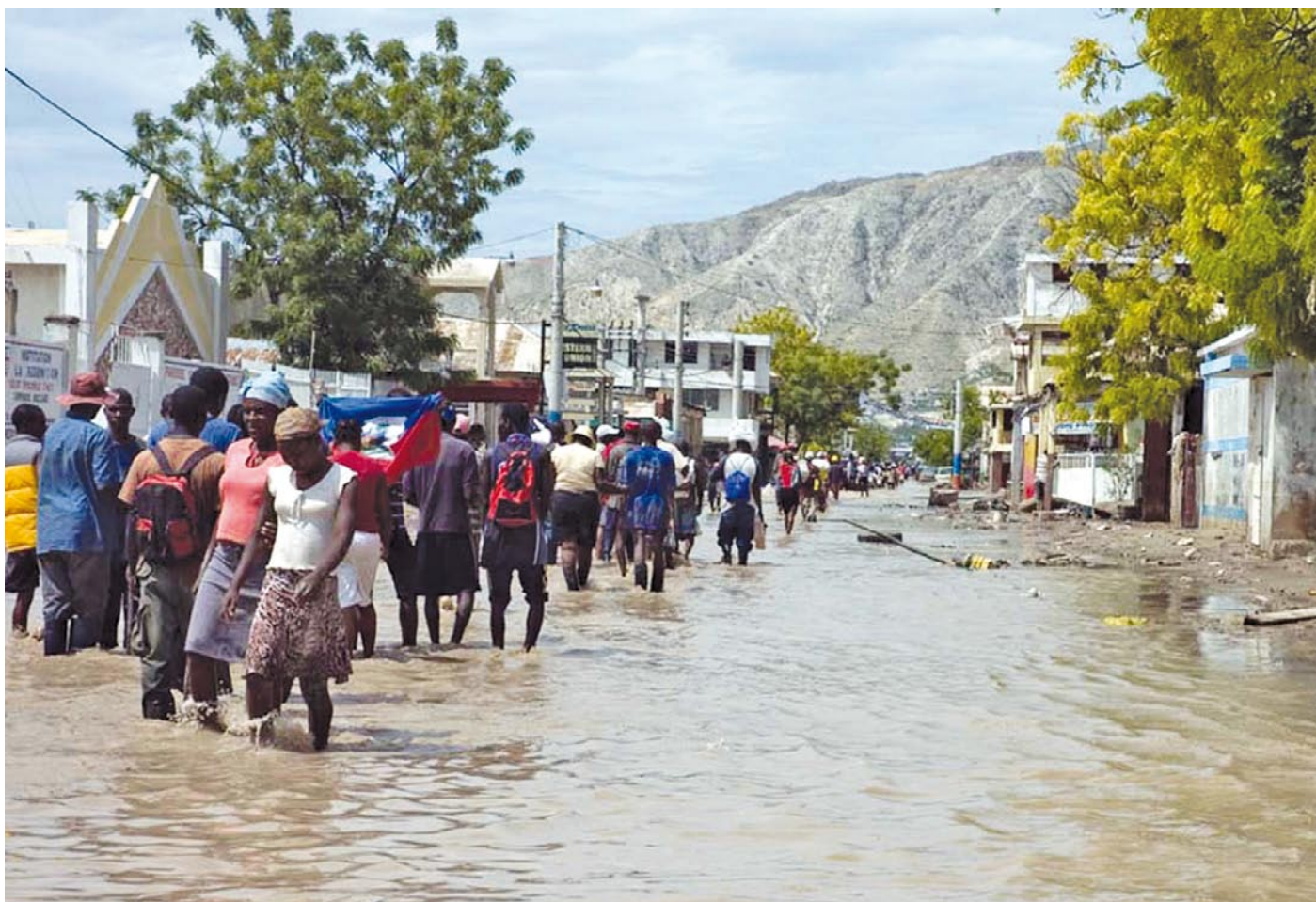
La gente abandona sus hogares para huir de las inundaciones acaecidas en Gonaïves, Haití.